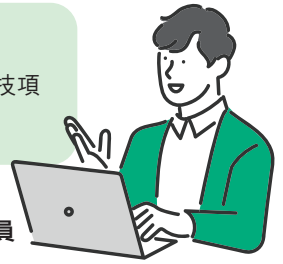
資訊科技管理員/資訊科技人員