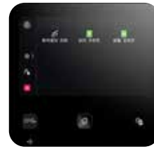
5 인치 컬러 터치 패널