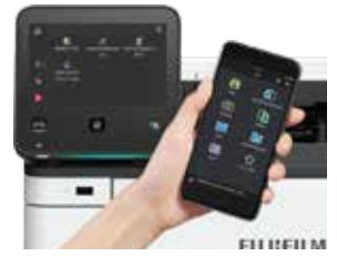
ส่งพิมพ์งานได้จากอุปกรณ์เคลื่อนที่