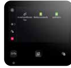
หน้าจอสีระบบสัมผัสขนาด 5 นิ้ว